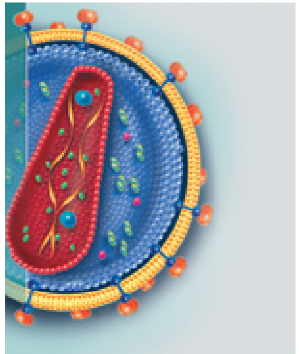
❶ Die HIV-1-Infektion führt beim Menschen fast immer zu einer chronischen, starken Aktivierung des Immunsystems.

Aids, eine der bedrohlichsten Infektionskrankheiten unserer Zeit, ist das Ergebnis der Übertragung von Affen-Immundefizienzviren auf den Menschen. HIV-1 M, der Haupterreger von Aids ❶, stammt ursprünglich aus Schimpansen der Art Pan troglodytes ❷ und wurde erst in der ersten Hälfte des vergangenen Jahrhunderts auf den Menschen übertragen. HIV-1 O, das sich weniger effektiv als HIV-1 M in der menschlichen Population ausbreitet hat und ebenfalls Aids ver-